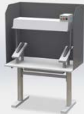
Prüftisch mit Höhenverstellung