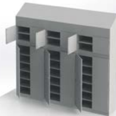
Hochschrank mit Schrägdach

High-Line: Kanten und Ecken mit 1 mm Radius, Auflagenocken verschraubt