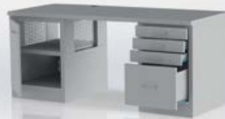
Schreibtisch mit PC-Schrank

Top-Line: Kanten und Ecken mit 12 mm Radius, geprägte Auflagen