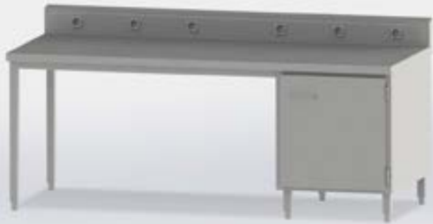
Arbeits Tisch mit Energieleiste, auch höhenverstellbar